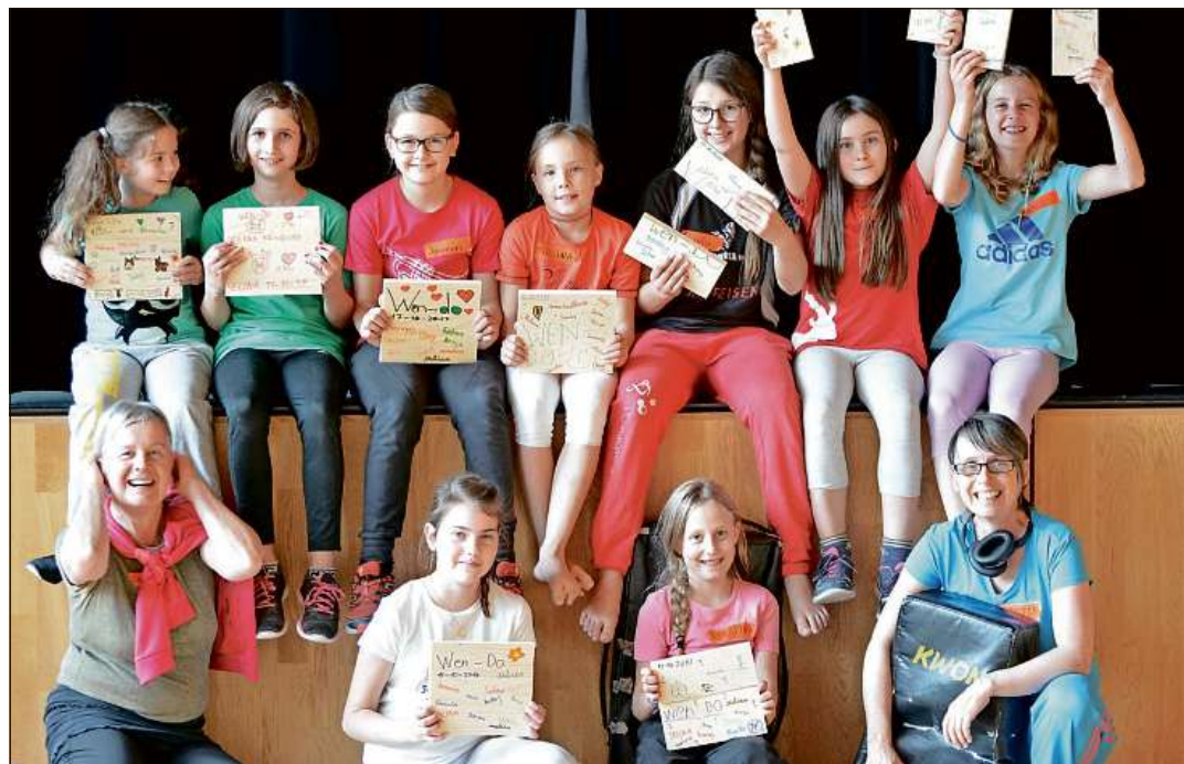
Las participantas e las menadras dil cuors da wen-do ch'ei vegnius organisaus dacuort e ch'ei vegnius purschius dalla Pro Juventute Cadi.

«Ils davos onns ei la vendita da marcas sereducida. Per quei motiv offerin nus era auters products. Dalla vignetta d'autostrada per exempel stattan diesch francs ella cassa dalla Pro Juventute Cadi», di Tuor. Ella paletta dils products che san vegnir empustai il medem mument cun las marcas ein per exempel era calendars, candelas, cartas, bons da kino ni era pralinas. Ina cumpart da tut quei che vegn vendiu va dil reminent era ella cassa dallas classes che fan la vendita. Sper la pusseveladad d'empustaziun cun la cuviarta eis ei era pusseivel d'empustar ils products sin la pagina d'internet projuventutecadi.ch . Il recav ord la vendita online va dil reminent buca mo en favur dalla Pro Juventute Cadi, mobein era dallas organizaziuns dalla Pro Juventute dalla Foppa e Lumnezia.